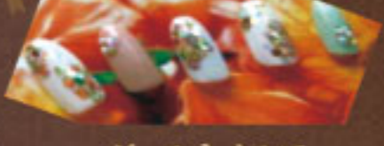
ジェルネイルでlove運、金運UP

ジェルネイルをされた方はハンドバッグをプレゼント キラキラつやつやジェルネイルと美肌バッグのコンビネーション!!