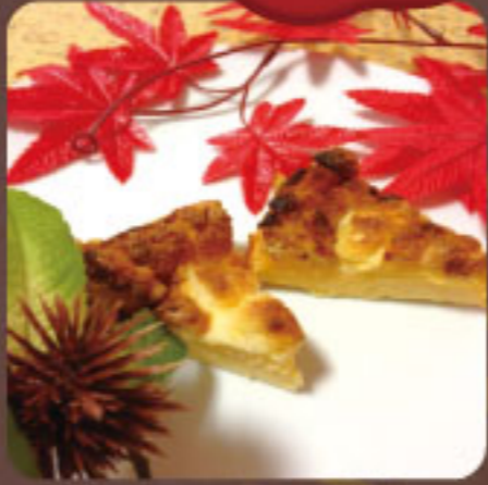
アイアシェッケ 350円