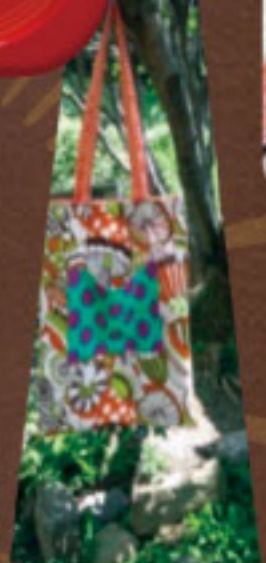
きのこにおべたんこバッグ (リバーシブル)