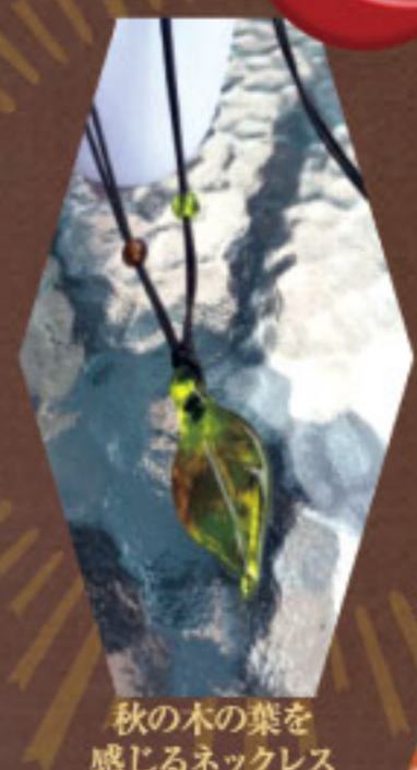
秋の木の葉を感じるネックレス