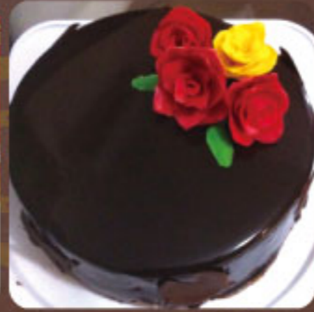
オーダーケーキ 2,500円 (12cm~)

おかげ様でニーシュも一周年を迎えました。一周年を記念してケーキをお買い上げのお客様にクッキーを一袋プレゼント致します。オリジナルオーダーケーキも随時受け付けております。あなたの特別な人にプレゼントしてみませんか?