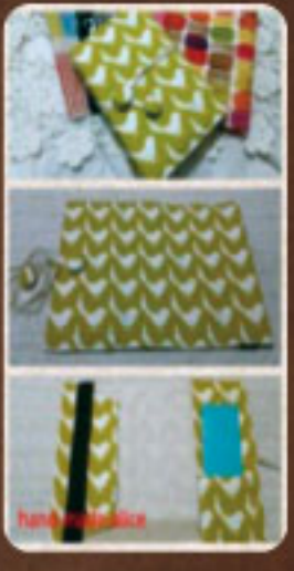
Aliceのブックカバーで読書の秋を楽しんで下さい